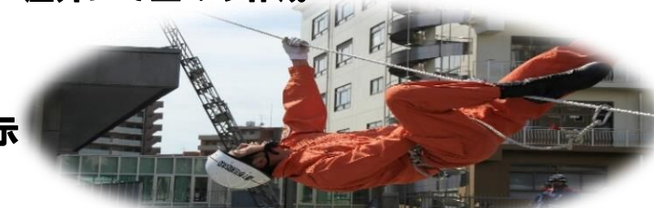
特別救助隊による救助演習訓練