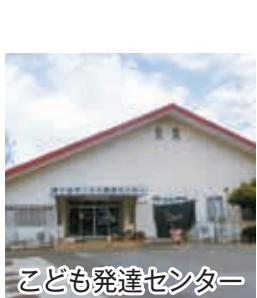
こども発達センター

○ 外国人住民を対象としたアンケート調査において、どのような意見や要望がありますか。 ○ 行政手続きに必要な申請書等が日本語表記で分かりにくい、市や学校からのお知らせ等の漢字にルビを付けてほしい、外国人向けの職業の紹介や福祉、救急等の窓口、子どもへの教育等の場面で円滑に対応できるよう、行政文書の多言語化や翻訳機器の整備等に取り組みしていきます。また、意見や要望等を把握するため、定期的にアンケートを実施していきたいと考えています。