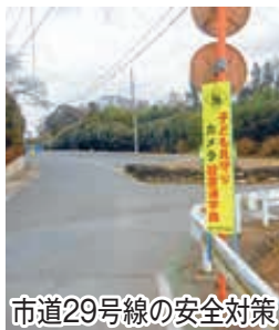
市道29号線の安全対策

○ 第四中学校通学路・市道29号線と北部小学校通学路・市道12号線の車のスピード対策として可搬式オービスの導入について見解を伺います。 ○ 鎌ヶ谷警察署においても両路線は取締りの対象路線であるとの見解であるため、積極的に要望していきます。 ○ 市道29号線の安全対策として、防犯灯や子ども見守りカメラの増設について見解を伺います。 ○ 防犯灯のLED化の完了、子ども見守りカメラの1台設置により、一定の抑止効果があったものと考えています。増設については今後の状況を見て検討していきます。 ○ 振り込め詐欺対策電話機