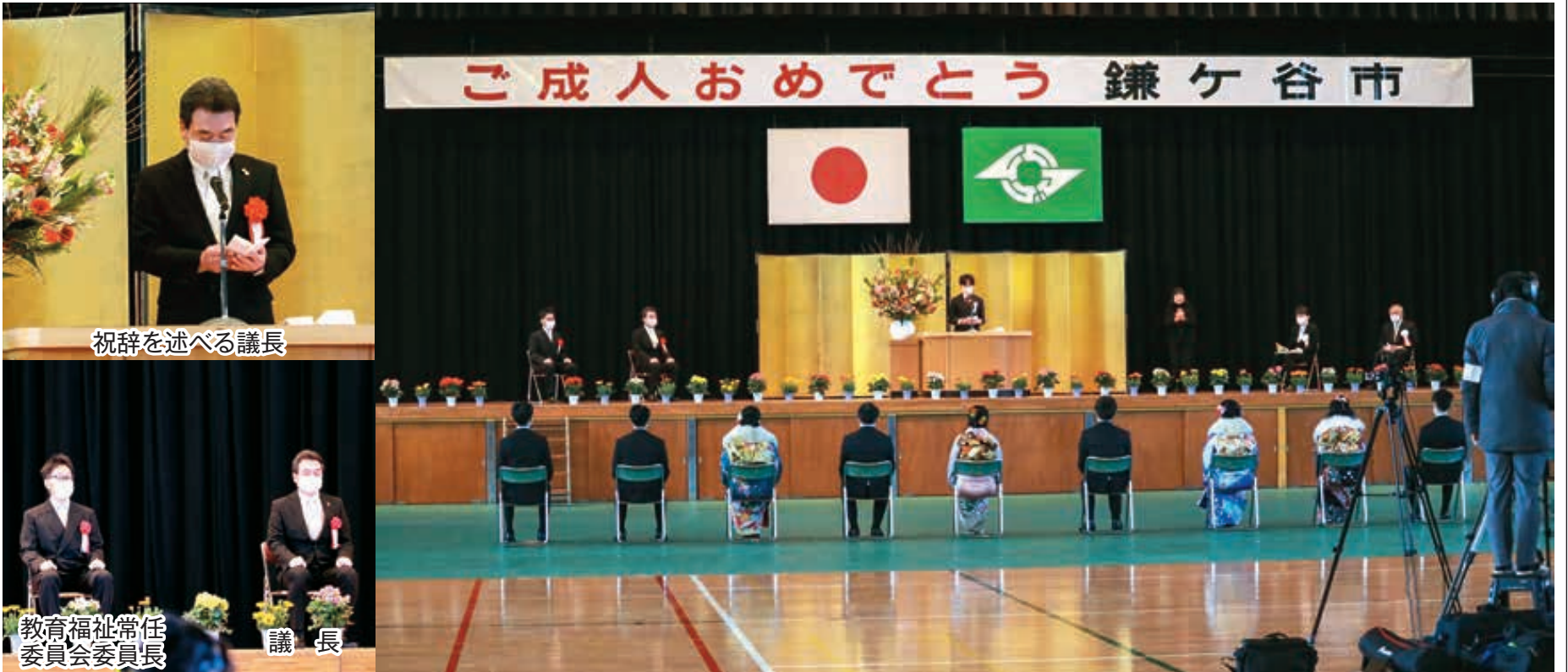
祝辞を述べる議長