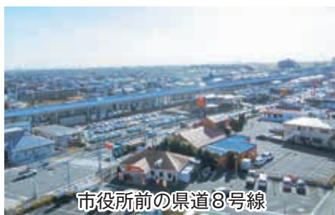
市役所前の県道8号線

リモートワークなど生活様式が多様化する中でも対応出来る体制を整備していく必要があるものと考えています。