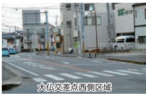
大仏交差点西側区域

としていたものをもとに6割とし、残りの4割については市内に居住する労働時間が週20時間の臨時雇用者を正社員1人とみなすこととしました。