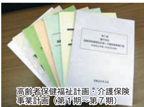
高齢者保健福祉計画・介護保険事業計画(第1期～第7期)

○ 高齢者保健福祉計画・介護保険事業計画の第1期から第7期までの保険料の基準額の推移について伺います。 ○ これまで当該計画に基づき、3年ごとに見直しを行い、第1期の基準額は2千800円で、第7期は5千270円となり、毎改定ごとに増額しており、制度発足時と比較すると2千430円の増、率にして85・6%の増となっています。 ○ なお、この間の65歳以上の高齢者人口は、平成12年10月で1万1千487人、令和2年同月時点で3万1千271人と、1万9千784人の増、率にして172・2%の増となっています。