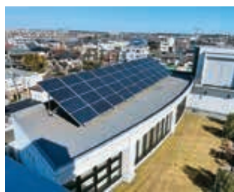
再生可能エネルギー

○ 介護予防の取組について伺います。 ○ 身体的機能の低下の予防、維持、改善を図るため、65歳以上の方を対象に体操や健康増進体操教室、ちよ筋教室や元気アップ講座などを設けさらに暮らしの中に生きがいや趣味を持てるように認知症 ○ カフェ、老人憩の家、談話室、老人クラブなどへの参加を促しています。今後も、活動の環境を整備し、高齢の方々の積極的な社会参加を推進していきます。 ○ 認知症予防に関する取組について伺います。 ○ 認知症の早期発見、早期