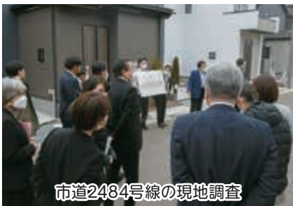
市道2484号線の現地調査

また、鎌ヶ谷市市道路線の認定及び廃止についての議案等を可決しました。写真は、都市・市民生活常任委員会で市道2484号線を市道として認定するための審査の一環として、現地調査をしているところです。