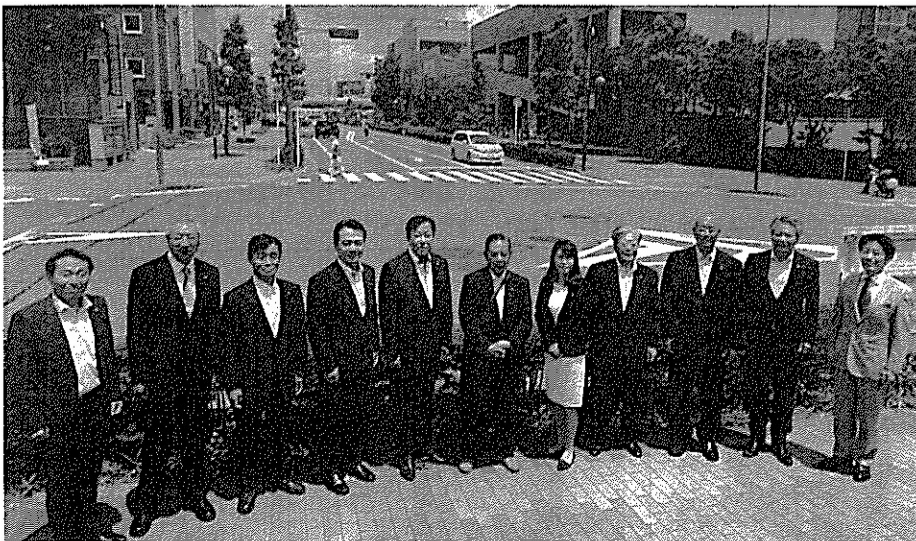
新たなスタートを切った政友会 11人のメンバー(聖火ランナーが走る予定の新鎌通りで)