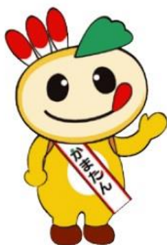
鎌ヶ谷市マスコットキャラクター かまたん