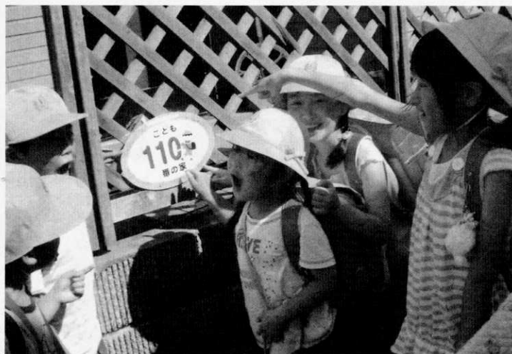
五本松小学校の子ども達

6月9日(火)五本松小学校PTA主催により「こども110番の家」を子ども達に覚えてもらうことを目的として「みんな探そう! こども110番」が開催されました。