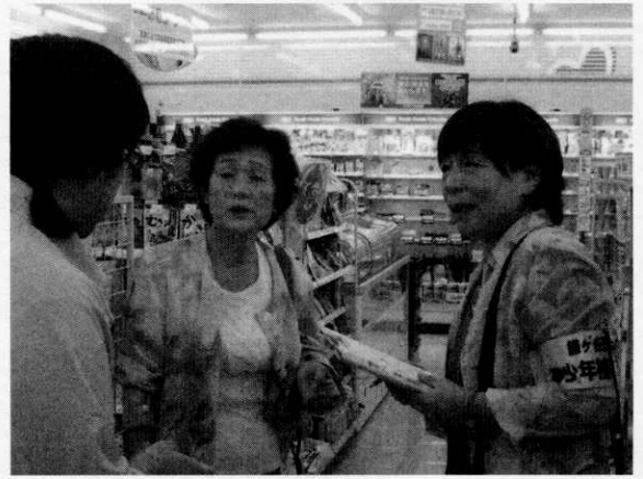
子ども達の様子を聴く補導員さん

学区内巡回補導後、中央公民館で情報交換を行いました。 補導員60名(先生12名含む)センター職員6名、鎌ヶ谷警察署 5名、少年警察ボランティア7名、東葛地区少年センター丸本 上席少年補導専門員から最近の子ども達の様子についての説明 がありました。