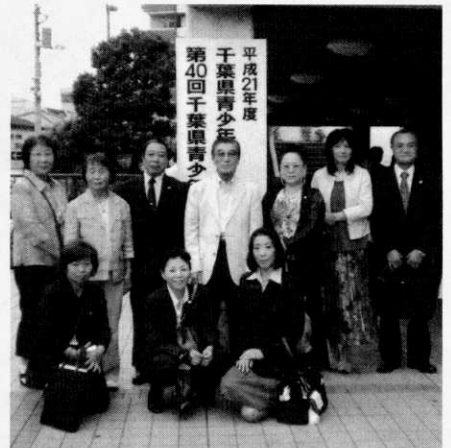
千葉県青少年補導員大会

補導員の委嘱を受けた時、我が子は中学一年生と三年生でした。パトロールから帰るとその日に会ったことを子供達に話して来ました。成人した今でも親子の会話は続いております。うれしいひとときです。成長する我が子の心の葛藤を、パトロールで出会った子ども達に重ねて見守る私自身も一緒に成長して来たように思えます。補導員を引き受けてよかったと思っています。街頭で出会った子ども達に「こんにちわ」とかけるひと声の大切さを伝えていきたいと思えます。