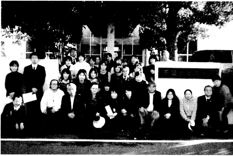
第2回 青少年補導員研修会 H21.11.18 千葉少年鑑別所