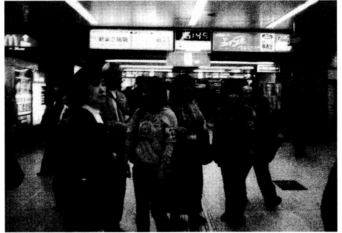
県下一斉列車補導