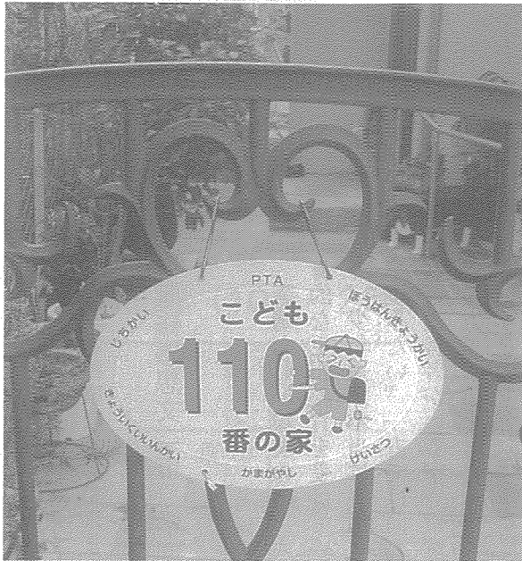
「こども110番の家」 新規協力者を募集しています！

〒273-0101 鎌ケ谷市富岡1-1-1 (三橋記念館3階) ☎047-445-4393