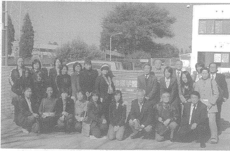
第2回 青少年補導員研修会 市原学園 H22.11.10