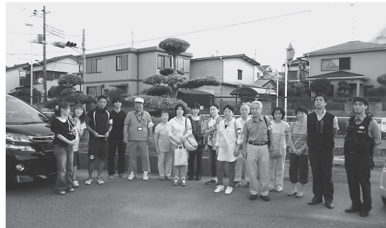
グループ別補導コース等の確認をしてさあ、出発！

からこそ、そこでの出会いとそこでの会話を大切にしたいと思っています。 引き続き「愛のひと声」をお願いします。