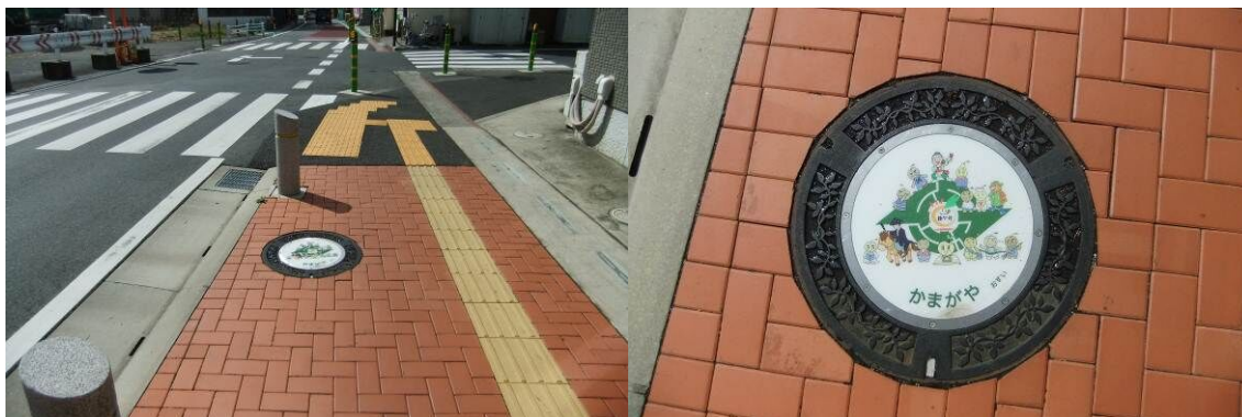
【かまがや盛り上げ隊デザインふた（道野辺中央 2 丁目）】

また、平成 24 年度から「かまがや盛り上げ隊（鎌ヶ谷を代表する大仏などのキャラクター）」デザインのふたを設置しております。