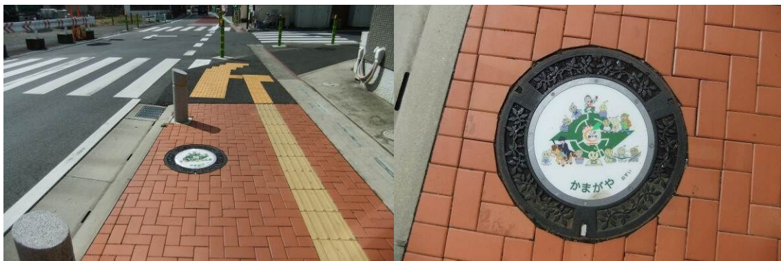
【かまがや盛り上げ隊デザインふた （道野辺中央 2 丁目）】

また、平成 24 年度から「かまがや盛り上げ隊（鎌ヶ谷を代表する大仏などのキャラクター）」デザインのふたを設置しております。