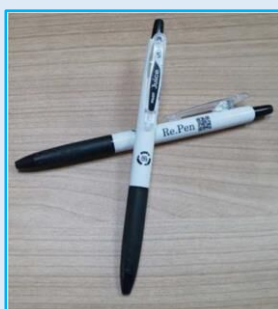
ボールペン (Re.Pen ジュース)