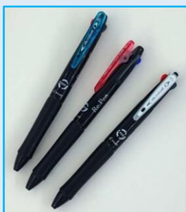
ボールペン (Re.Pen アクロ 3)