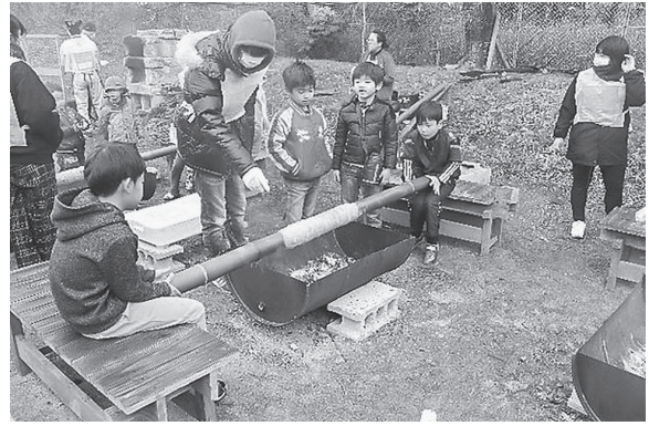
図8 バームクーヘン作り