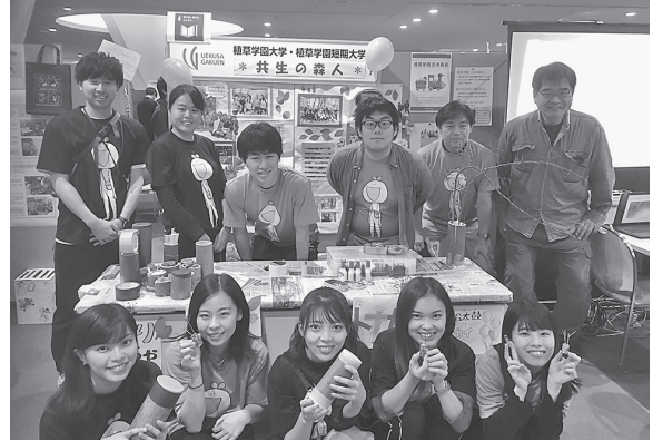
図 16 エコメッセへの参加