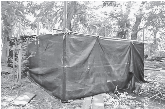
図 14 ホタル観賞用の蚊帳