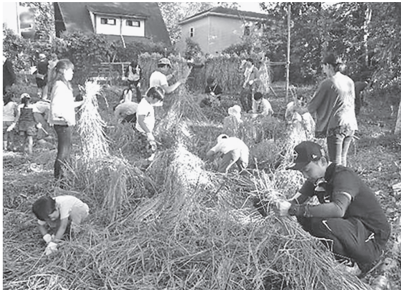
図 13 稲刈り体験