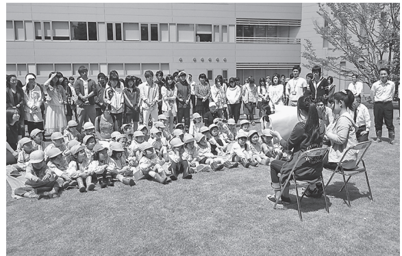
図 17 幼稚園児へのサポート 1