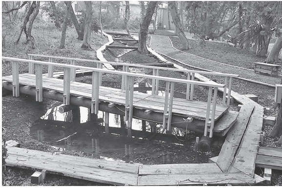
図4 スギ材を使った小川の周りの遊歩道