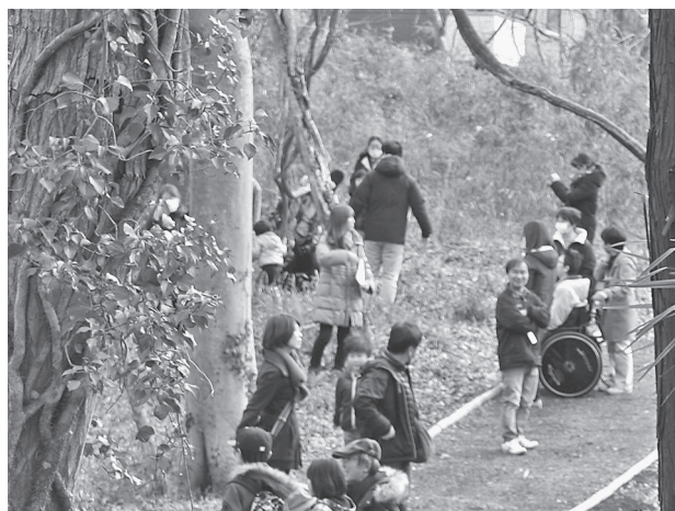
図3 車椅子での散策