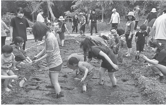
図 12 田植えの風景