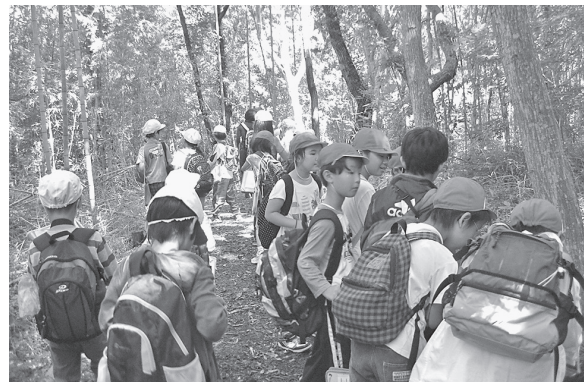
図 19 小学生の自然体験