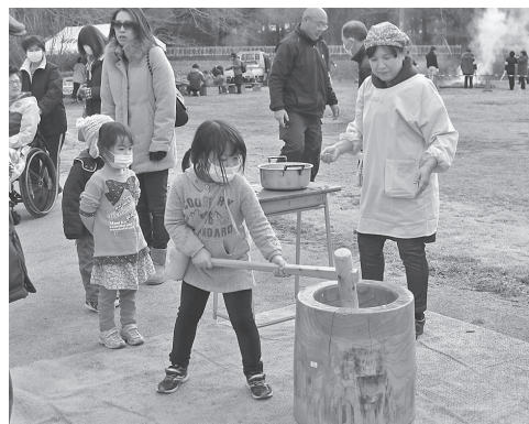
図10 ビオトープ祭りでの餅つき体験