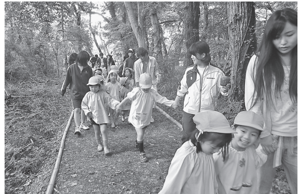
図 18 幼稚園児へのサポート 2