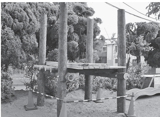
図6 附属幼稚園での遊具作り