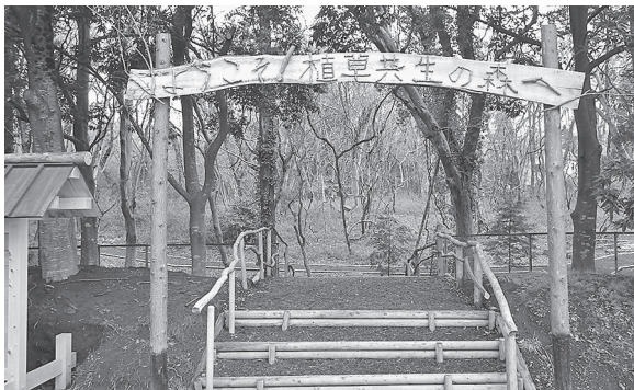
図5 スギ材を使って作ったビオトープの入り口