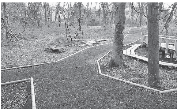
図7 タケで作った散策路の縁