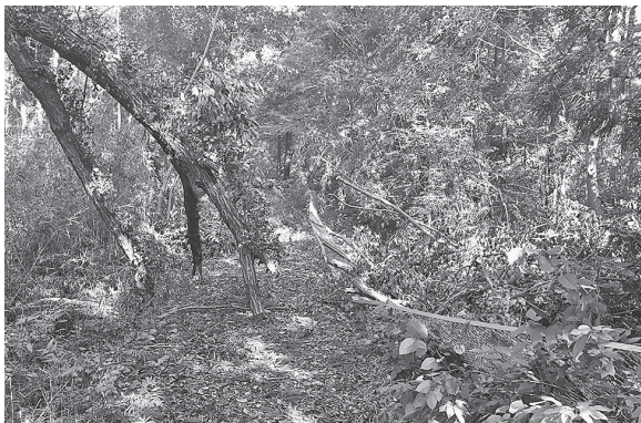
図 15 台風の後、散策路に木が倒れ、フェンスも壊れた