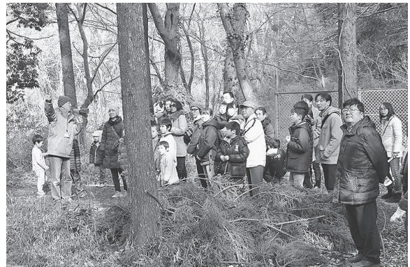
図9 ビオトープ祭りでの散策のガイド