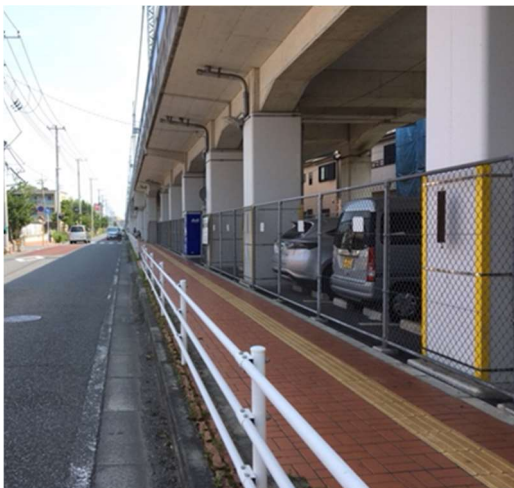
高架下利用イメージ図1

新京成線連続立体交差事業の高架下利用につきましては、平成30年度から、市役所内の意向調査、市民の皆様にご意見を募集を行いました。その後、千葉県、新京成電鉄㈱の三者で協議を行い、この度、鎌ヶ谷市で利用する高架下15%の範囲がまとまったことから、本計画をもって、高架下利用を進めていきます。