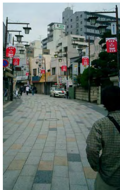
大正浪漫通り ろまん