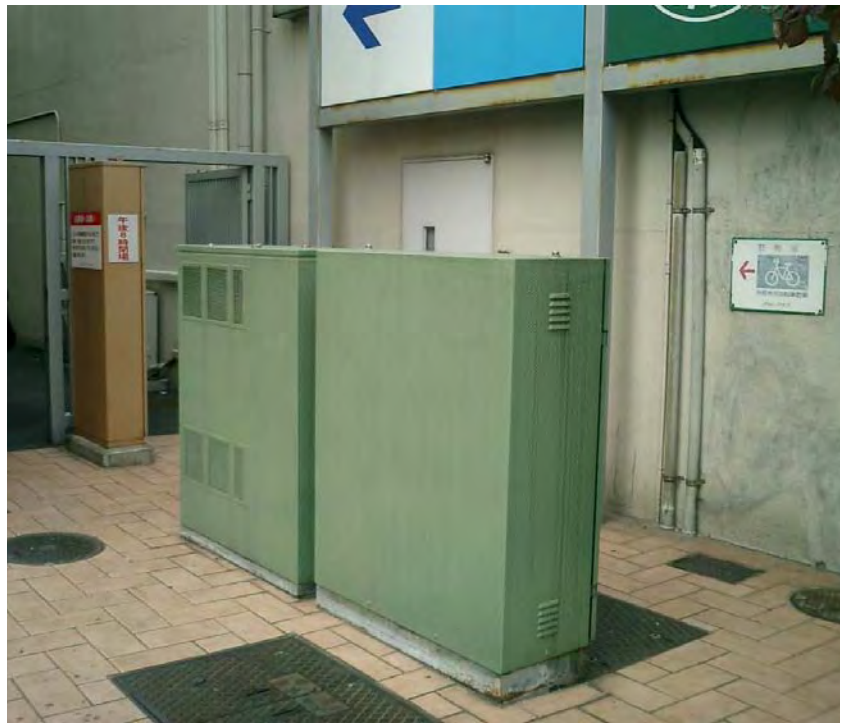
【写真】 クアモール内の道路標識