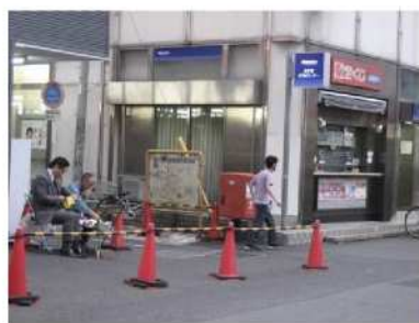
交通量調査当日の風景

以上の結果より、ATM鎌ヶ谷が目指す「人にやさしいみちづくり」として、よい結果がでていると言えます。