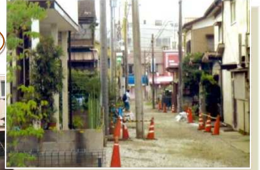
↑施工前 電柱が道路上にあり、危険でした