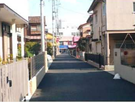
歩きやすい道路になりました ↓施工後

危険で見栄えも悪かったこの道が、今回の工事で直線4m幅に簡易舗装され、見通しの良い快適な道路に面目を一新しました。