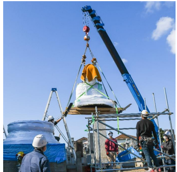
仮台へ移動中の鎌ヶ谷大仏

また、今回の調査では、表からは分からない鑄造工程の詳細も知ることができ、当時の鑄物師の技術を垣間見ることができました。