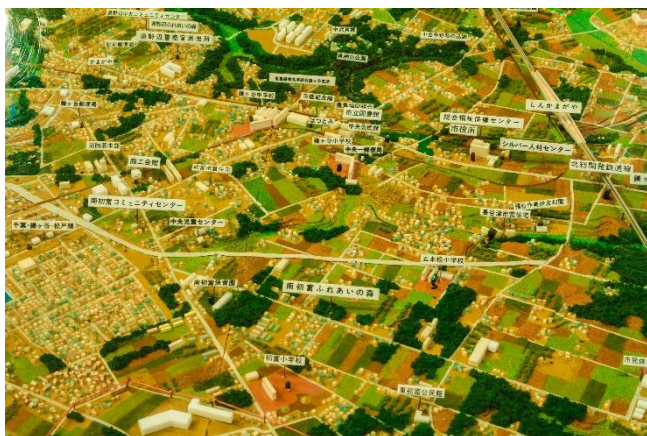
市域模型(初富駅周辺)

これは昭和53年に作成し、平成9年に当時の街の状況に改修したもので、平成21年頃まで市役所の市民課側の入口に設置していたことから、目にしたことのある方もいらっ