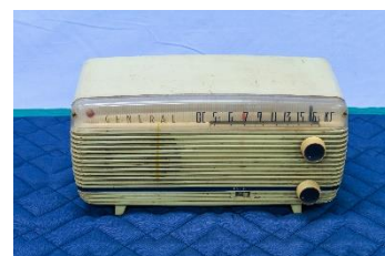
昭和30年代の真空管ラジオ