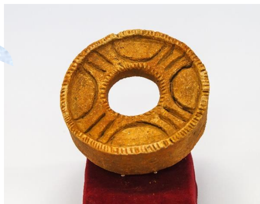
中沢貝塚出土の耳飾り

展示内容 ◆埋蔵文化財＝中沢貝塚・木戸脇貝塚・大木戸貝塚(中沢)などから出土した遺物、遺跡の写真パネル、中沢貝塚の貝層剥ぎ取り断面 ◆歴史・民俗資料＝市内で発見・調査した明治・大正・昭和・平成時代の歴史資料